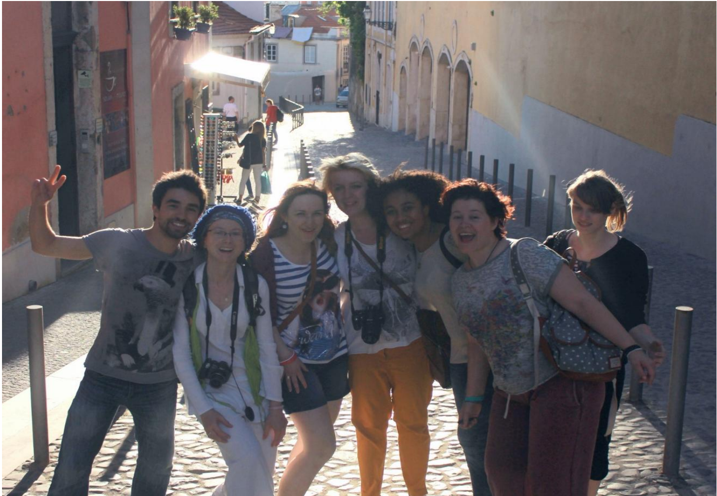
At home in Europe