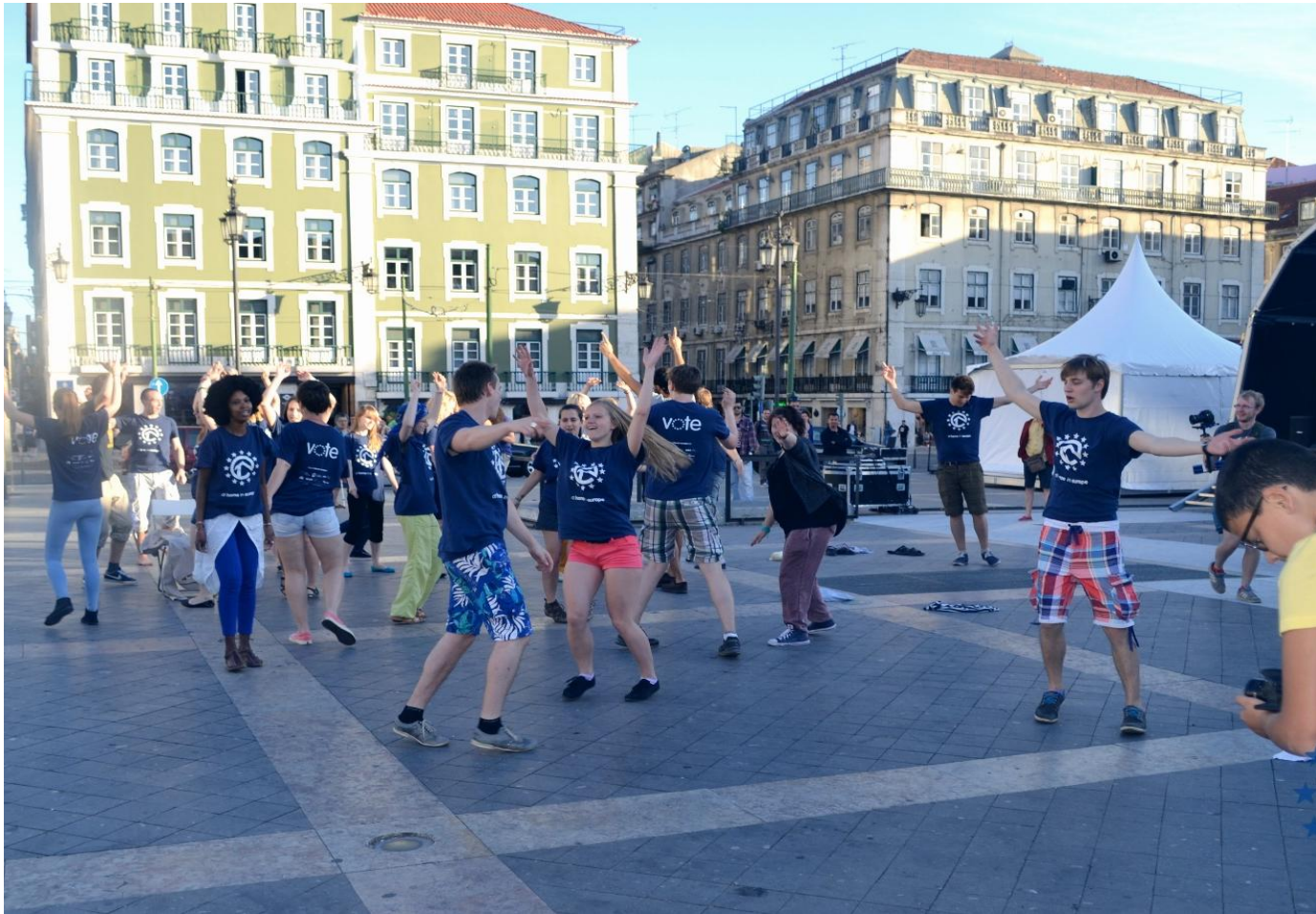
At home in Europe